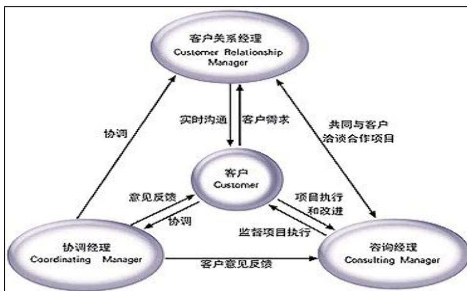
图 5 3C 完全客户服务模式

项目组将切实保证例会时间、参与人员、会议内容等根据实际项目状况和约定来制定并执行。